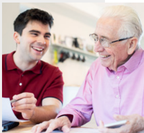
Favoriser les relations intergénérationnelles