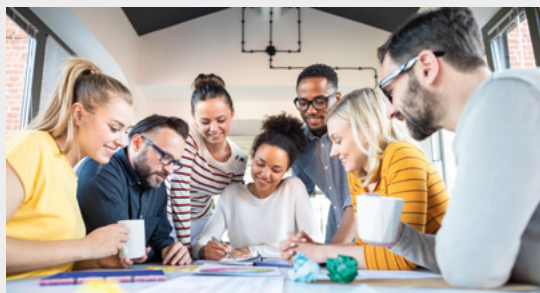
Créer un pôle Innovation et Intelligence collective pour le développement de nouvelles activités économiques et entrepreneuriales sur notre territoire