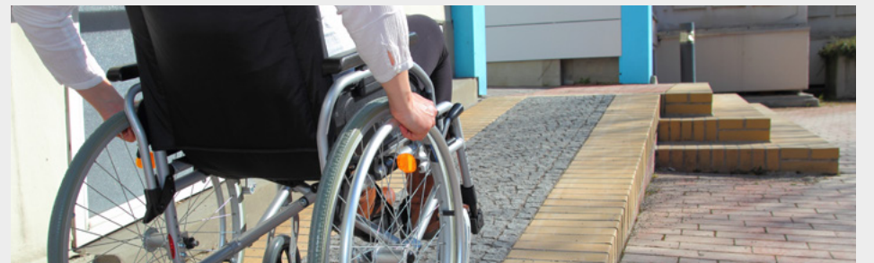
Améliorer l'accessibilité des espaces publics et bâtiments communaux