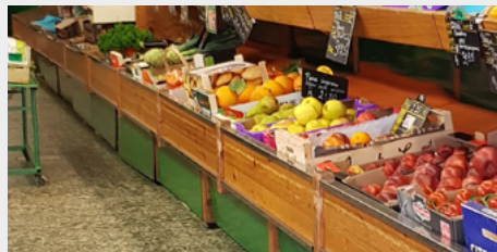
Inciter et accompagner les commerçants pour qu'ils s'installent...