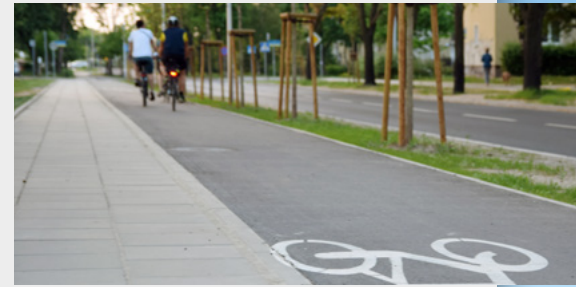
Réaménagement et sécurisation des pistes cyclables en concertation avec SantaVélo.