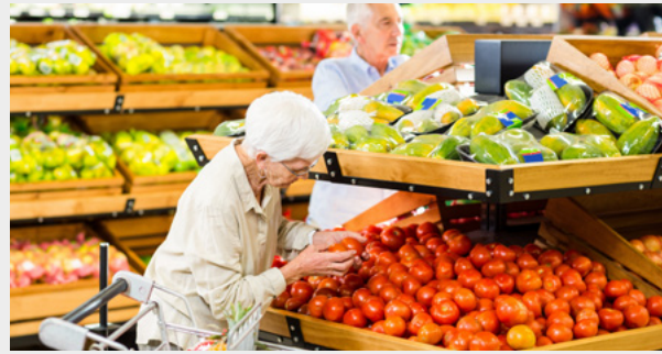
Favoriser les commerces de bouche en centre ville