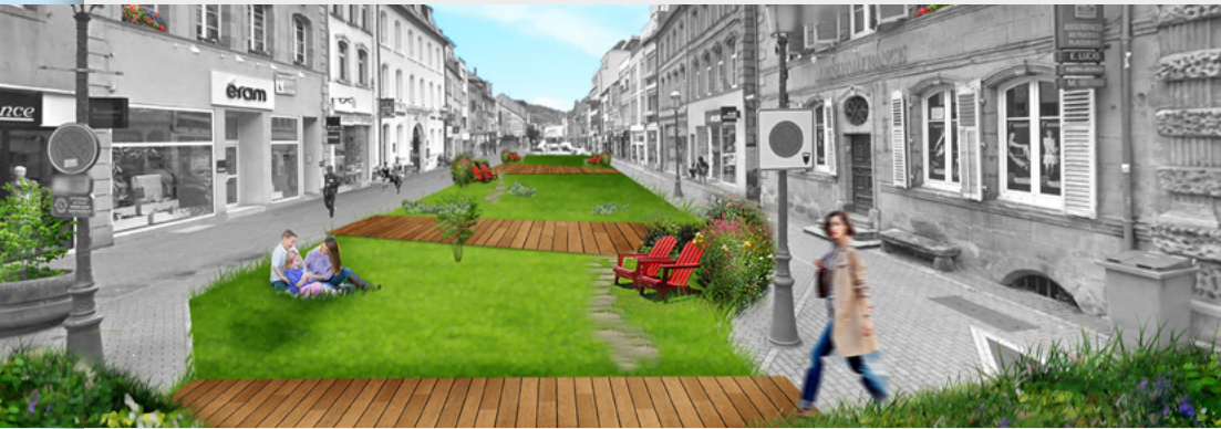
Dès cet été, nous lancerons une opération d'envergure temporaire en transformant la rue commerçante Hirschauer en zone piétonne, végétalisée, arborée et animée par des artistes (Musique et expositions éphémères). Cette expérimentation permettrait de faire rayonner Saint-Avold, de booster notre commerce local et de tester un nouveau plan de circulation.