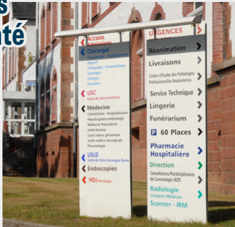
Créer une maison de la santé et de services