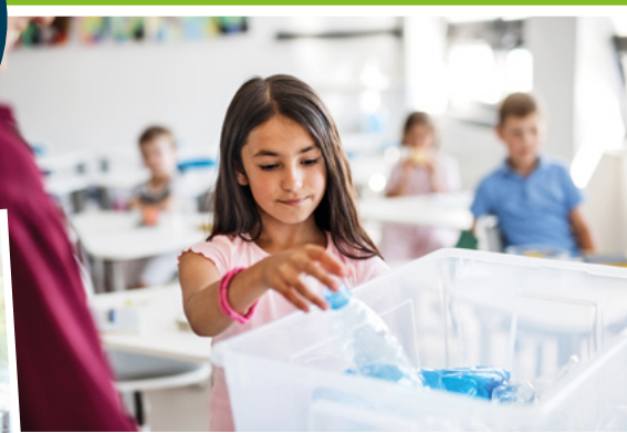
Actions concrètes avec les jeunes du territoire