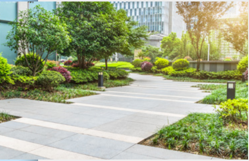
Chemins piétonniers et aménagements urbains propices à la promenade et à l'envie de consommer

Objectif : remettre, après un bilan désastreux, Saint-Avold sur un bon cap et retrouver ainsi sa grandeur passée.